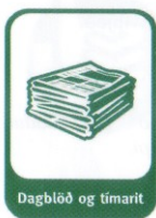
Dagblöð og tímarit

Rafhlöður og gler má ekki setja í Grænu tunnuna.